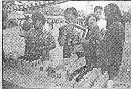
นำไปขายหรือแสดงนิทรรศการที่ไหน ก็มีคนสนใจ ล้นหลาม

ปลัด อบต.สันป่าตอง บอกว่า หลังจากที่ชาวบ้านเริ่มเข้าใจมากขึ้น ทำให้ชาวบ้านหันมาทำนมพุดและครีมพุดผสมขาย จนถึงขณะนี้ มีทั้งหมด 5 กลุ่มด้วยกัน รวมสมาชิกทั้งหมด 70 คน ส่วนรายได้จากการขายทาง อบต.ปล่อยให้สมาชิกดูแลกันเอง แต่มีการตั้งเงื่อนไขว่ายอดขายทั้งหมดนั้น แบ่งออกเป็น 50% ให้อุปกรณ์เพิ่มเติมส่วนอีก 50% เป็นกำไรและใช้ในการปรับปรุงรูปแบบผลิตภัณฑ์ จนถึงเวลานี้ผลิตภัณฑ์นมพุดและครีมพุดผสมนมพุดรสกล้วยได้รับการยอมรับจากประชาชนและมียอดขายที่เพิ่มขึ้นมากกว่าเดิม