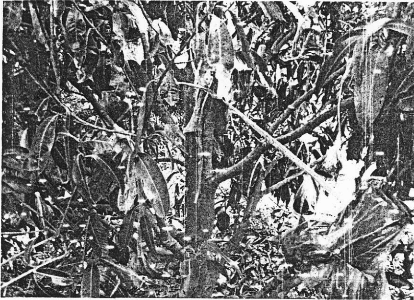
การทาบกิ่งมะยงชิด-มะปรางหวาน

ทำผลผลิตให้ เมื่อปีที่ผ่านมามีผลผลิตจะดี จะเก็บได้ประมาณ 3 ตัน ที่สวนจะเน้นมากในเรื่องของคุณภาพผลผลิตที่ทำออกมาจะต้องทำให้ลูกออกมาสีสด ผิวสะอาด ผิวเกลี้ยง ไม่มีตำหนิ ที่สวนเมื่อเก็บแล้วจะได้ประมาณ 5 ตู้ออนเทนเนอร์ ตู้อันหนึ่งจะอยู่ที่ประมาณ 700 กิโลกรัมและถ้ามีตำหนิก็จะจัดส่งไปขายที่ตลาดจังหวัดจันทบุรี ทางสวนจะจัดส่งแต่ผลมะยงชิดเพื่อส่งออกอย่างเดียวไม่ได้ทำกิ่งพันธุ์เพื่อการส่งออก ส่วนมากจะขายกิ่งพันธุ์ในบ้านเรามากกว่าจะขายตามงานต่างๆ แต่อยากแนะนำให้มีมาดูแลและเลือกที่สวนมากกว่าราคาจะอยู่ที่ 150-200 บาท แต่ถ้าลูกใหญ่ตัดลูกแล้วจะราคาที่ 500-600 บาท