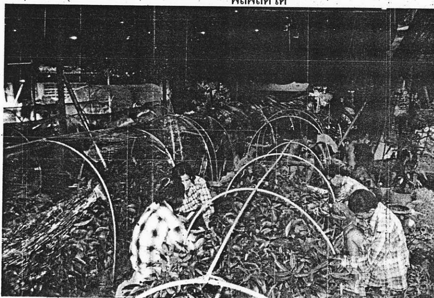
คนงานกำลังเสียบยอดเผิงชิด-มะปรางหวาน อย่างขะบายมัน

การตัดแต่งกิ่ง โดยปกติแล้วทางสวนจะแต่งเฉพาะกิ่งข้างในตรงพุ่มและที่ไม่แต่งกิ่งนอกตรงพุ่มเพราะว่าจากประสบการณ์ของคุณพวงศร ถ้าตัดแต่งกิ่งนอกพุ่ม ผลผลิตจะได้น้อยกว่า เพราะดอกจะไม่ออกเท่าที่ควร และช่วงการแต่งกิ่งจะเป็นในช่วงหลังการเก็บเกี่ยวผลผลิตไปแล้ว ประมาณปลายเดือนกุมภาพันธ์ ถึงเดือนมีนาคม ซึ่งในช่วงเดือนมีนาคมก็จะเริ่มใส่ปุ๋ยบำรุงต้น แล้วก็เริ่มตัดแต่งกิ่งที่ไม่แข็งแรงและกิ่งที่มีราสีชมพูก็ให้ตัดออกไป แล้วก็นำเอาปูนแดงที่ใช้กับการกินหมากป้ายกันโรคราสีชมพูได้ นี่ก็เป็นภูมิปัญญาของชาวบ้านในการประหยัดต้นทุนเรื่องค่าใช้จ่ายได้ ด้านของผลผลิตจะออกดอกช่วงเดือนมกราคม และประมาณเดือนมีนาคมช่วงต้นๆ จะเป็นช่วงเก็บผลผลิตได้