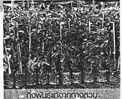
กิ่งพันธุ์จากทางสวน

เจ้าของสวนสุวรรณยังฝากมาถึงท่านผู้อ่านและผู้สนใจอีกว่า “ผลใหญ่กว่าไข่” เชิญแวะชมด้วยตาตัวเอง สีต้นสวยงามเหมือนไม้ประดับ รสชาติดีพอใช้ได้ และทางสวนยังจำหน่ายกิ่งพันธุ์ คุณภาพเชื่อถือได้