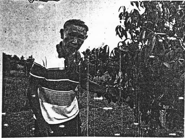
มะยงชิดพันธุ์บางขุนนนท์แก่ที่รับทำพันธุ์