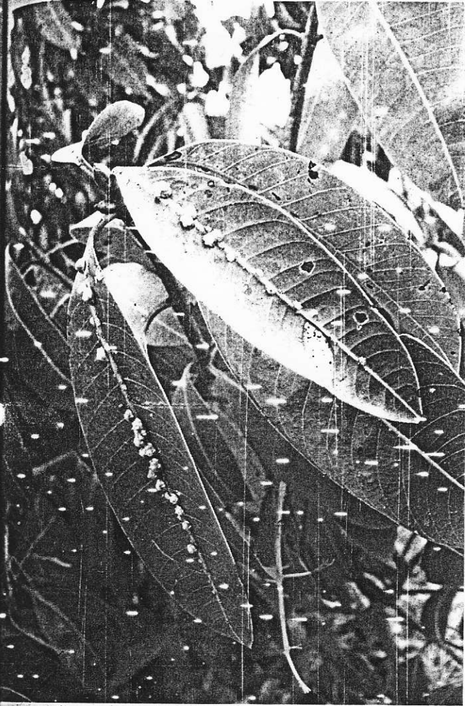
เพลี้ยหอย

ติดผล ซึ่งโดยทั่วไปแล้วชาวสวนมะขงชิด มะปรางหวาน จะทราบกันเป็นอย่างดี ไม่ว่าจะเป็นการให้ปุ๋ย ยา ส่วนใหญ่ก็ไม่ ต้องให้มาก เพียงแต่ต้องคอยดูแลเป็นพิเศษบางช่วงเวลา ของการเจริญเติบโต และต้องทราบว่าช่วงไหนควรบำรุง มาก ช่วงไหนบำรุงน้อย เนื่องจากสภาพความสมบูรณ์ที่ แตกต่างกันของประเทศไทย