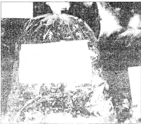
ภาชนะสะอาดที่บรรจุน้ำพริกกุ้งคั่วแห้งรสอร่อย เพื่อนำออกขาย

ในครัวเรือนสังคมไทยนั้นหากมือโศกขาดน้ำพริกไปสักอย่างบนโต๊ะอาหาร รสชาติของอาหารมือนั้นจะลดลงไปมากทีเดียว แต่ถ้าหากได้น้ำพริกอร่อย ๆ สักถ้วยก็จะทำให้อาหารมือนั้นเพิ่มรสชาติได้มากกว่าทีเดียว และถ้าหากได้น้ำพริกกุ้งคั่วแห้งรสอร่อย มีผักประกอบด้วยแล้วรับรองแซบแน่