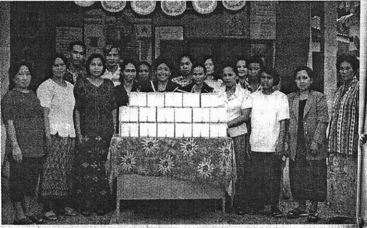
ไข่เค็มวังวิเศษ ความภาคภูมิใจของชาวตรัง

อาหารที่สามารถเก็บไว้ได้นานและเป็นที่ยอมรับโคของประชาชนทั้งในท้องถิ่นและต่างจังหวัด ดังนั้น ตนจึงรวบรวมพรรคพวกที่เป็นแม่บ้านเริ่มจาก 10 คน โดยมีการเก็บเงินจากสมาชิกคนละ 100 บาท เพื่อจัดซื้อวัตถุดิบมาผลิตไข่เค็มเพื่อจำหน่ายครั้งแรกจำหน่ายเฉพาะ