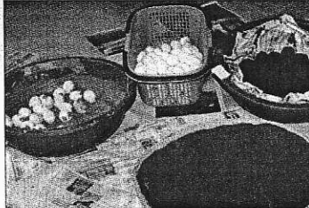
ไข่พร้อมที่จะคลุกกับส่วนผสมของดิน เกลือ เกลือไอโอดีน และอื่น ๆ ก่อนที่จะนำไปบรรจุกล่อง

เป็นเอกลักษณ์เฉพาะตัวเกือบทุกแห่ง ตำบลคลองปาง เป็นชุมชนที่มีชาวบ้านปลูกหลักปักฐานอยู่กันอย่างยาวนาน อยู่ในเขตพื้นที่การปกครองของ อ.วังวิเศษ จ.ตรัง ประชาชนส่วนใหญ่นับถือศาสนาพุทธ มีพื้นที่ครอบคลุม 9 หมู่บ้าน ประกอบไปด้วย บ้านคลองโกง บ้านคลองปาง บ้านโพธิ์น้อย บ้านเขาพระ บ้านหนองหัด บ้านหนองกก บ้านห้วยเนียง บ้านต้นปรอง และบ้านด่านสายสภาพพื้นที่โดยทั่วไปเป็นที่ราบลุ่ม ชาวบ้านประกอบอาชีพปลูกยางพาราเป็นส่วนใหญ่ รองลงมาเป็นการทำข้าวเพื่อเก็บไว้กินเป็นปี ๆ ไข่หลังจากวางเว้นจากภารกิจงาน ชาวบ้านส่วนใหญ่จะมีการรวมกลุ่มกันเพื่อสร้างผลิตภัณฑ์ของหมู่บ้านเพื่อใช้กันเอง จำหน่ายในหมู่บ้าน และขยายตลาดออกไปสู่ต่างพื้นที่ตาม