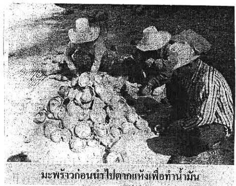
มะพร้าวก่อนนำไปตากแห้งเพื่อทำน้ำมัน

“ภายหลังมีการทดลองแล้วได้ผลจริง แต่ขณะนี้ ปัญหาว่าชาวบ้านส่วนใหญ่ยังไม่ค่อยมั่นใจว่าสูตรน้ำ มันจะส่งผลเสียต่อเครื่องยนต์หรือไม่ ดังนั้นเพื่อให้เกิด ความเชื่อมั่น ผมจะใช้สูตรน้ำมันมะพร้าวไปเดิมรถ ยนต์ของทางราชการก่อนเพื่อเป็นการนำร่อง แล้วคิด สติกเกอร์บอกชาวบ้านว่าเป็นรถยนต์ที่ใช้ น้ำมันมะ พพร้าวหรือพลังงานทดแทนจากพืช “ซึ่งขณะนี้เป็นที่น่ายินดีว่าประธานกรรมการ บริหารองค์การบริหารส่วนอำเภอทับสะแกทั้ง 6 แห่ง และกลุ่มเกษตรกรชาวสวนมะพร้าวก็พร้อม ที่จะสนับสนุนโครงการอย่างเต็มที่”