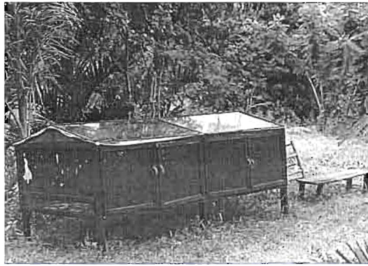
ตู้ตากแห้งพริกและสมุนไพรร ใช้แสงแดดส่องผ่านพลาสติกและกันสิ่งสกปรก