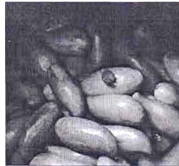
มะม่วงดองเก็บไว้ในโอง

ออกมาช่วงฤดูกลางเช่นมะม่วง ราคาจะถูก มากจนไม่คุ้ม ถ้าจะผลิออกมาขายหรือ แม้แต่มะขามเปรี้ยวก็ถูกเพราะแทบทุกบ้าน จะมีอยู่แล้ว จึงต้องเพิ่มมูลค่าด้วยการ แปรรูปแบบดั้งเดิมและเธอนยืนยันว่าการแปรรูปคนเดียวก็ทำได้ถ้าสองคนยิ่งทำได้มาก