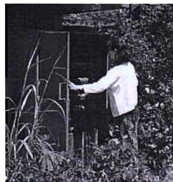
คุณเปอนเปิดให้ดูสภาพภายในตู้อบ

ออกมาช่วงฤดูกลางเช่นมะม่วง ราคาจะถูก มากจนไม่คุ้ม ถ้าจะผลิออกมาขายหรือ แม้แต่มะขามเปรี้ยวก็ถูกเพราะแทบทุกบ้าน จะมีอยู่แล้ว จึงต้องเพิ่มมูลค่าด้วยการ แปรรูปแบบดั้งเดิมและเธอนยืนยันว่าการแปรรูปคนเดียวก็ทำได้ถ้าสองคนยิ่งทำได้มาก