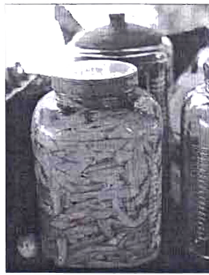
โหลน้ำเชื่อมแบบดั้งเดิม