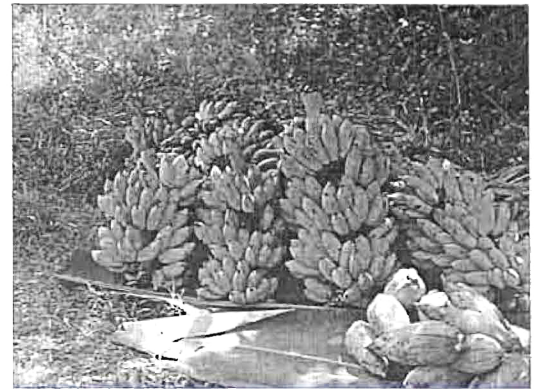
กล้วยจากสวน ถ้ามีมากก็นำมาทำกล้วยอบ