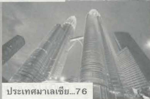
ประเทศมาเลเซีย...76