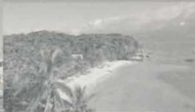
ประเทศฟิลิปปินส์...66