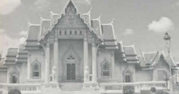
ประเทศไทย...48