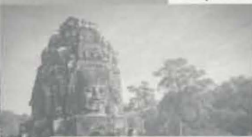
ประเทศกัมพูชา...154