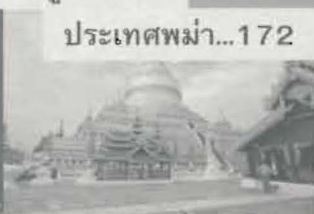
ประเทศพม่า...172