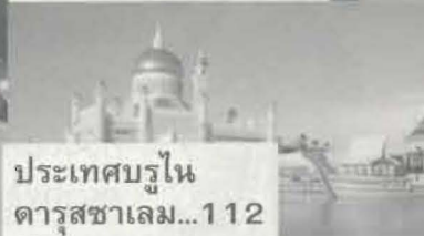
ประเทศบรูไน ดารุสซาลาม...112