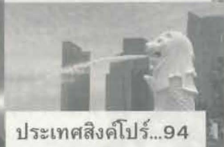
ประเทศสิงคโปร์...94