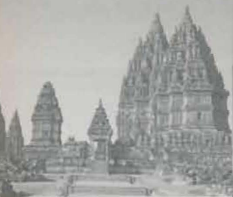
ประเทศอินโดนีเซีย...128