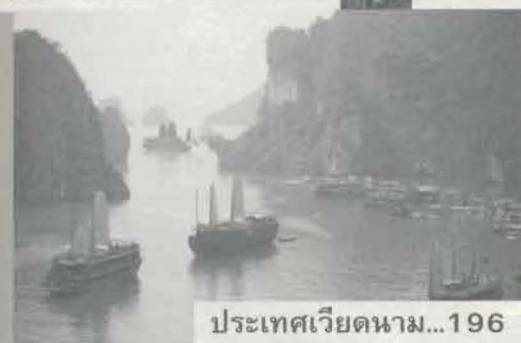
ประเทศเวียดนาม...196