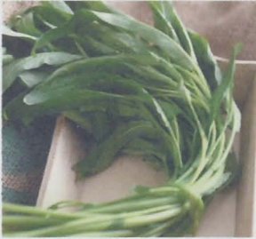
ผักบุ้งจีน