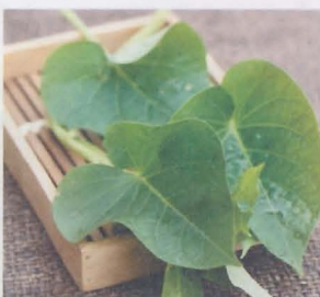
ใบมันเทศ sweet potato vine