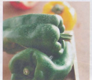
พริกหวาน sweet pepper