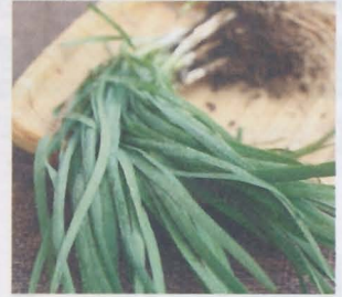
กุยช่าย Chinese chive