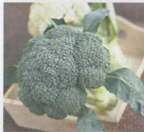
บร็อกโคลี่ sprouting broccoli