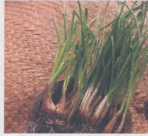
ต้นหอม welsh onion