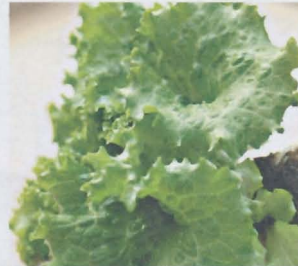
ผักกาดหอม