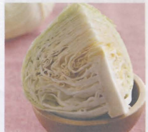
กะหล่ำปลี common cabbage