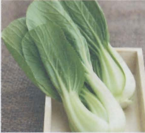
กวางตุ้งไต้หวัน