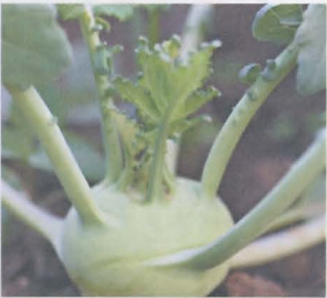
กะหล่ำปม kohlrabi