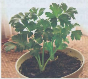
ซีลนฉ่าย celery