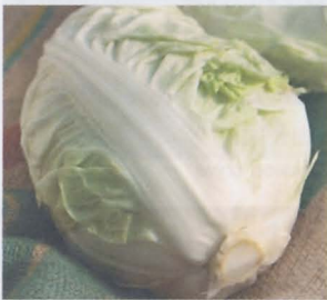
ผักกาดขาวปลี Chinese cabbage