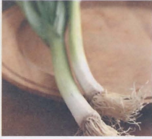
กระเทียม garlic