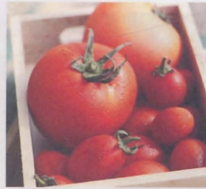
มะเขือเทศ tomato