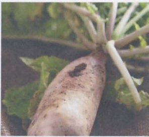
หัวไชเท้า white radish