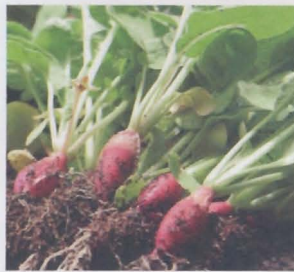
หัวไชเท้าสีแดง cherry belle radish