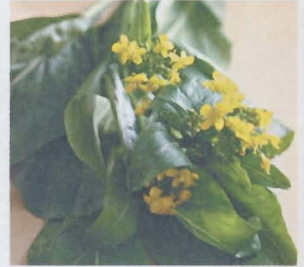
คะน้าจีน