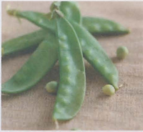
ถั่วลันเตา garden pea