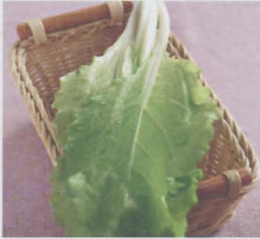
กวางตุ้ง